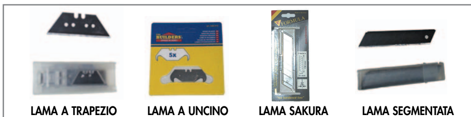
LAMA A TRAPEZIO